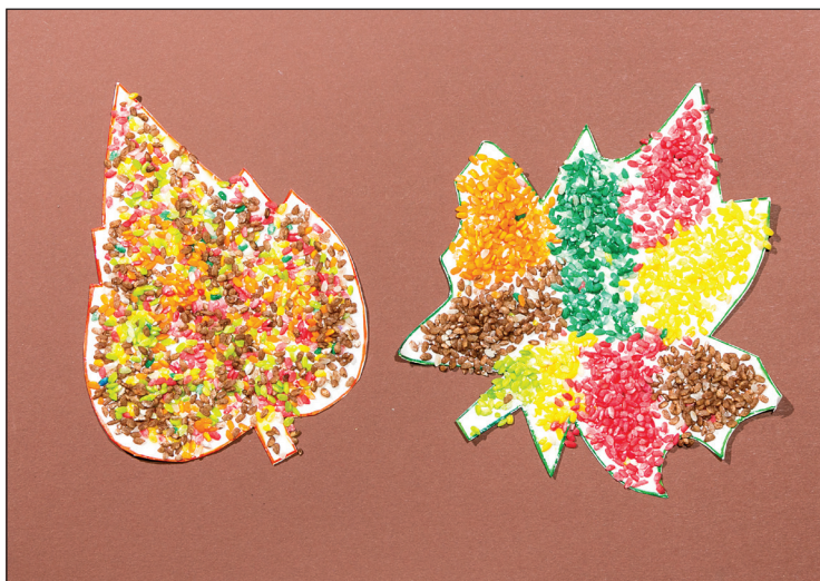
3.14 Podzimní list krtek Vítko