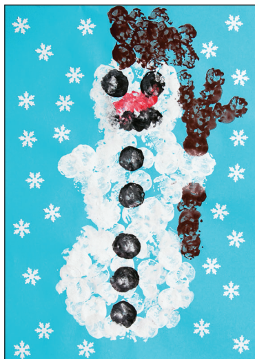
4.1 Krtek Vítek a sněhulák