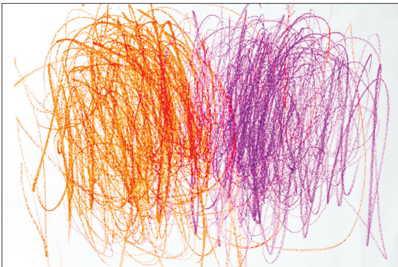
1.3 Krtek Vítek tancuje