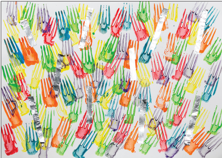
4.5 Krtek Vítek a ohňostroj